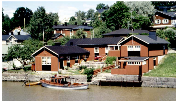
Kaupunkitalo Lundberg, Vanha Porvoo

Toimisto on siirtynyt CAD-avusteiseen suunnitteluun vuonna 1987. Kolmiulotteinen - ja virtuaalisuunnittelu on aloitettu toimistossamme vuonna 1992.