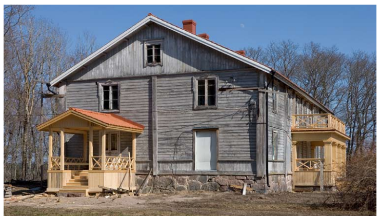
Myrskylän kartano, Myrskylä: Peruskorjaus- ja restaurointityöt